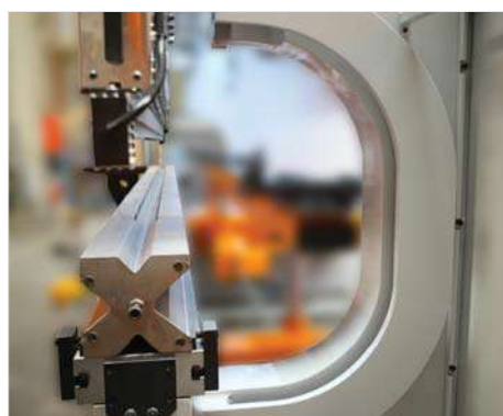
■ Incavi speciali fino a 1500 mm (O)