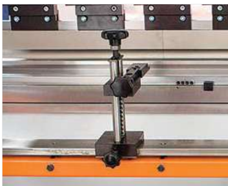
■ Puntali registro (S)