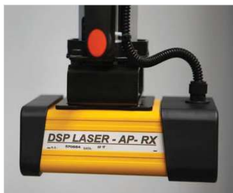
■ Fotocellule di sicurezza anteriori DSP MCS AP (O)