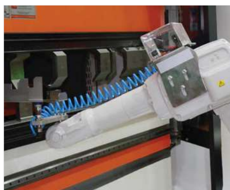
■ Soluzioni robotizzate apportano vantaggi in efficienza, qualità, velocità, performance, costi e sicurezza.