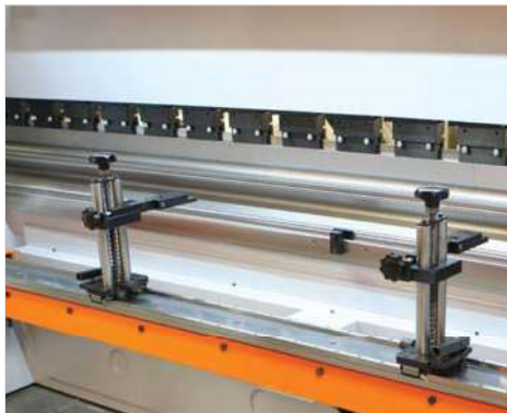
■ Il registro standard Power-Bend Pro ha asse X motorizzato e asse R manuale (S)