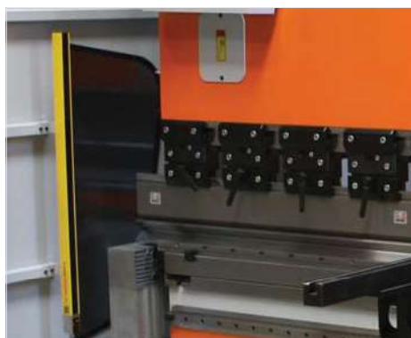
■ Fotocellule a barriera di sicurezza conformi alla normativa CE (S)