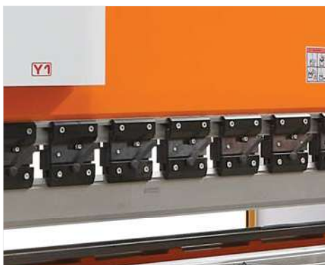
■ Sistema rapido di sbloccaggio utensili per sostituzione rapida e facile(S)