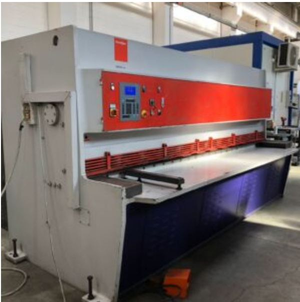
CESOIA A GHIgliOTTINA IDRAULICA "BYSTRONIC" USATA