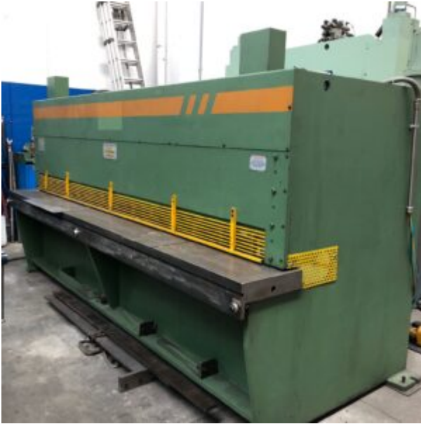
CESOIA A GHIgliOTTINA IDRAULICA "BL" USATA